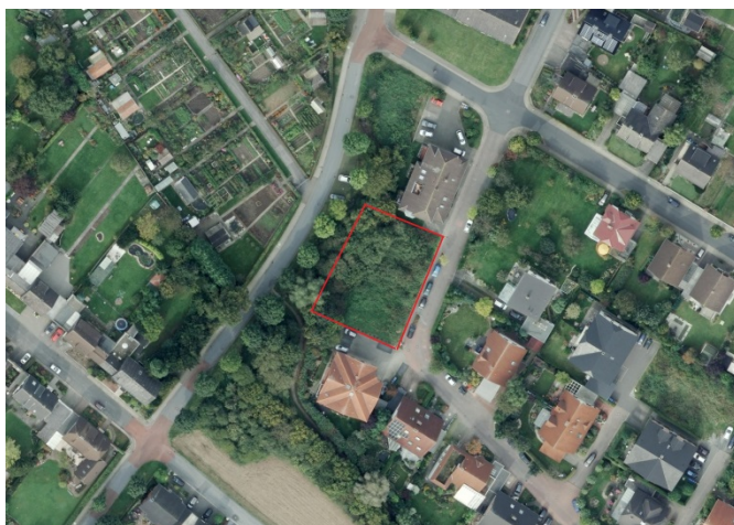
Auszug aus dem Luftbild - (Datenlizenz Deutschland Land NRW / Kreis Warendorf (2018) Version 2.0)