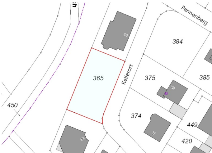
Auszug aus der Katasterkarte (Datenlizenz Deutschland Land NRW / Kreis Warendorf (2018) Version 2.0)