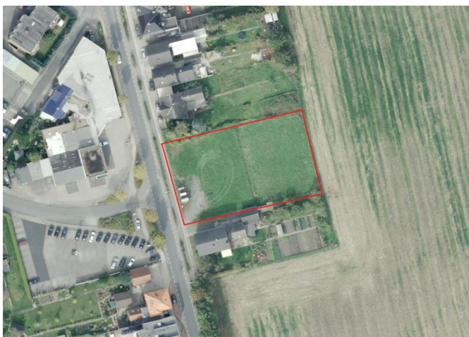
Auszug aus dem Luftbild