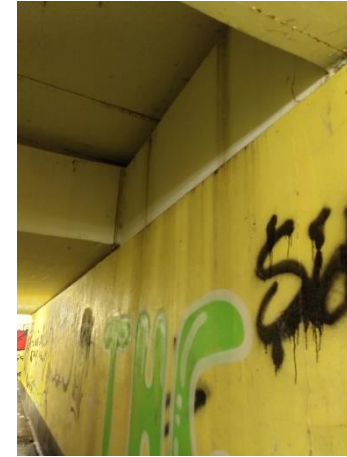
Rostiges Wasser läuft von oben die Wand entlang

Derzeitiger Zustand der Fußgängerunterführung zwischen Hauptstraße und Im Werl -> Baulich: dunkel, alt, renovierungsbedürftig, großer Hall -> Emotional: erzeugt Unwohlsein, ruft Ängste hervor, Augen zu und durch