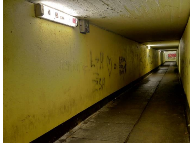
Fußgängerunterführung mit 50 Meter Länge führt zur Straße „Im Werl“