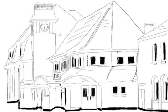
Denkmalgeschütztes ehemaliges Bahnhofsgebäude als Kulturstifter im Ort