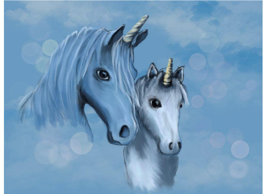
Beispielmotiv für die kreative Reise durch den Tunnel

Eine bewegte und dynamische Malerei sorgt für ein spannenden Spaziergang durch den Tunnel.