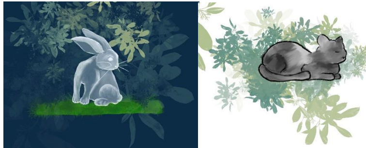
Beispielbilder für Motive im Eingangsbereich

Durch einen Himmel am Beginn des Eingangs laden wir jede und jeden dazu ein, die Reise durch den Tunnel anzunehmen. Der Himmel wird in einer freundlichen einladenden Stimmung gemalt, wobei noch offen ist, ob Vögel zu sehen sein werden. Die Besuchenden werden in eine Welt entführt, die nur Fantasie und Farbe hervorbringen kann.