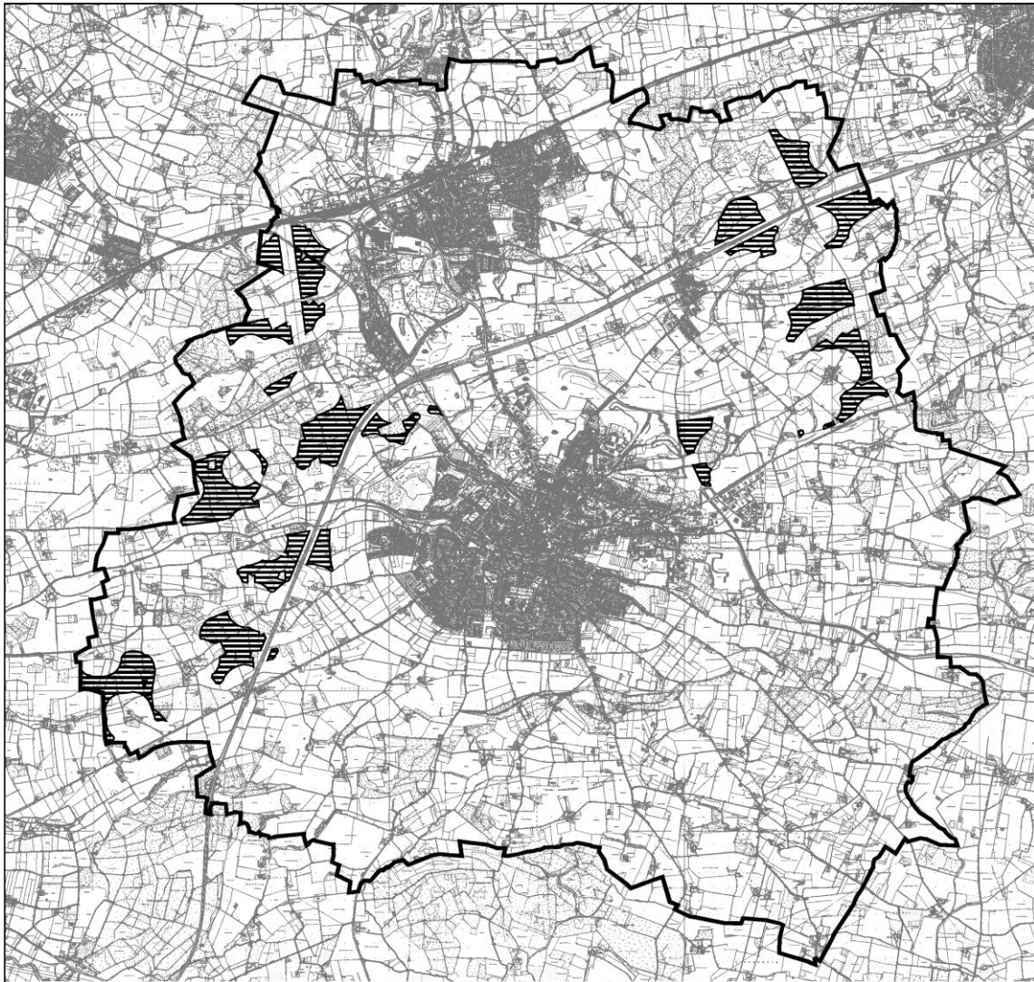
Übersichtsplan, ohne Maßstab

Der Geltungsbereich umfasst das gesamte Gemeindegebiet der STADT BECKUM.