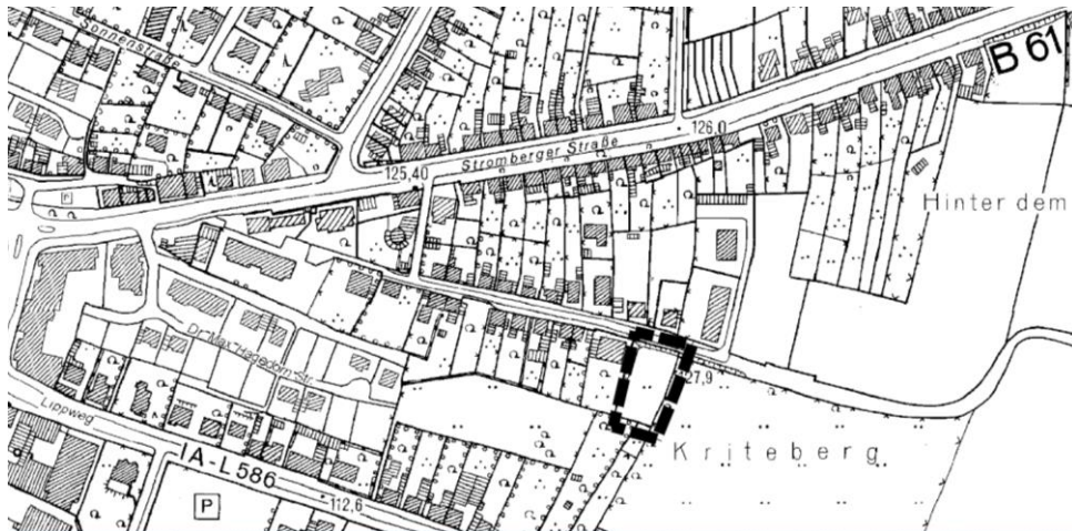
Übersichtsplan, ohne Maßstab, Datenlizenz Deutschland – Land NRW/Kreis Warendorf (2017) – Version 2.0

Der Satzungsbereich umfasst die Flurstücke 372 und 373, Flur 6, Gemarkung Beckum, gelegen auf der südlichen Seite der Straße Wilhelmshöhe.