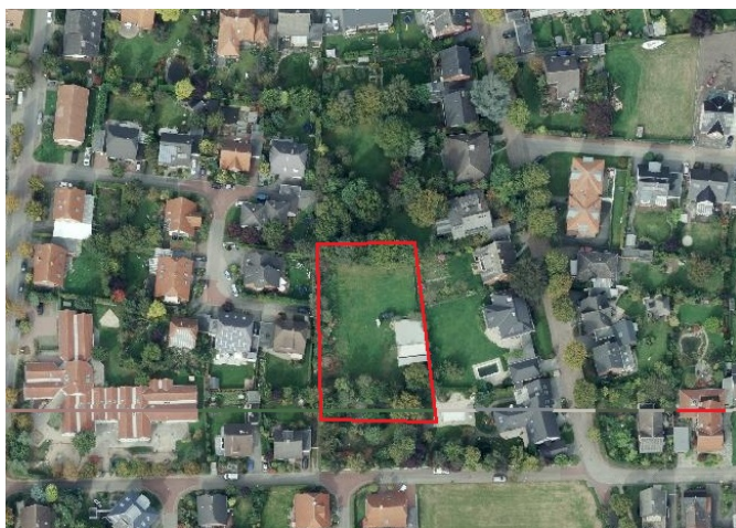
Auszug aus dem Luftbild - (Datenlizenz Deutschland Land NRW / Kreis Warendorf (2018) Version 2.0)