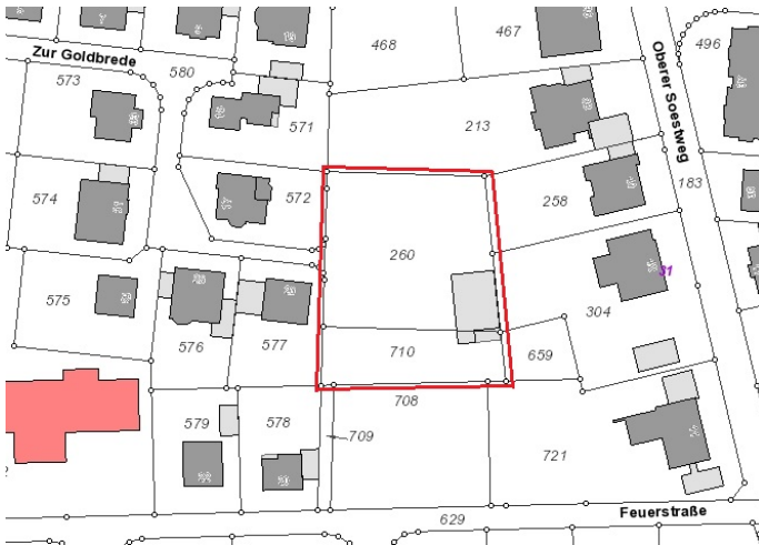
Auszug aus der Katasterkarte - (Datenlizenz Deutschland Land NRW / Kreis Warendorf (2018) Version 2.0)