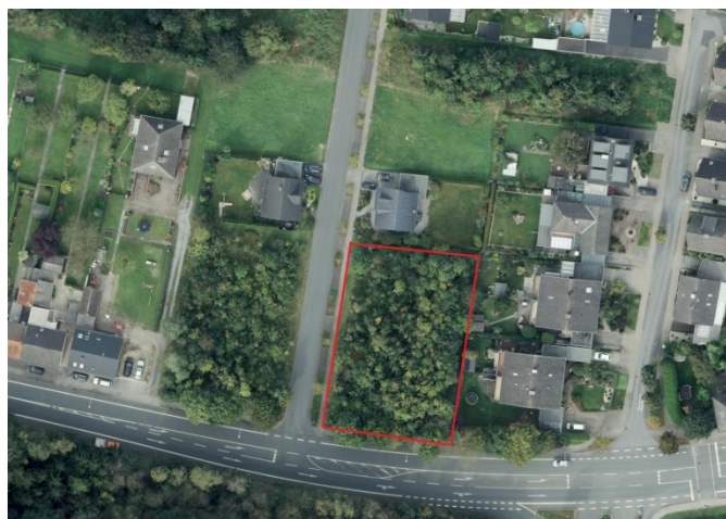
Auszug aus dem Luftbild