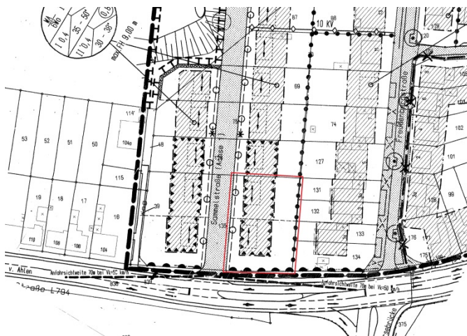
Auszug aus dem Bebauungsplan