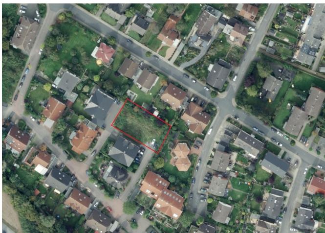
Auszug aus dem Luftbild (Datenlizenz Deutschland Land NRW / Kreis Warendorf (2018) Version 2.0)