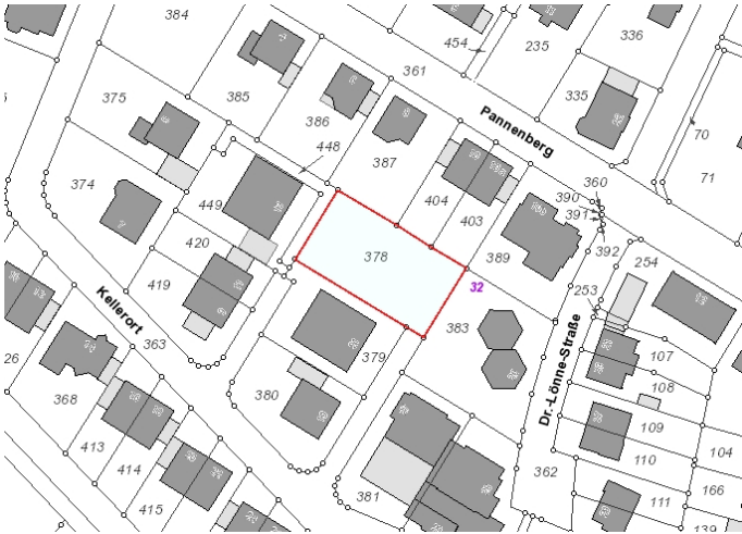
Auszug aus der Katasterkarte (Datenlizenz Deutschland Land NRW / Kreis Warendorf (2018) Version 2.0)