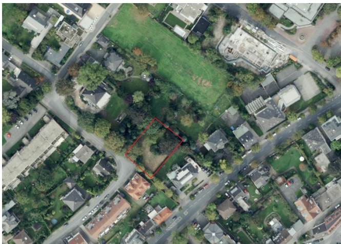
Auszug aus dem Luftbild - (Datenlizenz Deutschland Land NRW / Kreis Warendorf (2018) Version 2.0)