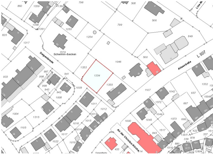
Auszug aus der Katasterkarte - (Datenlizenz Deutschland Land NRW / Kreis Warendorf (2018) Version 2.0)