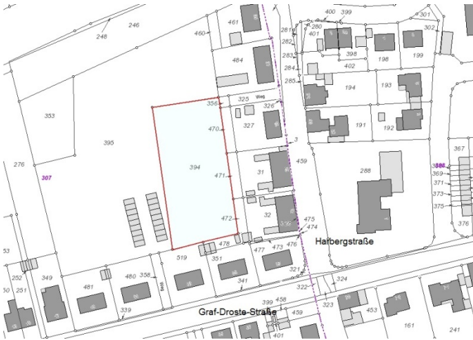
Auszug aus der Katasterkarte