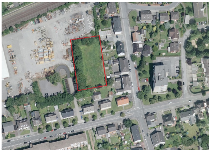
Auszug aus dem Luftbild - (Datenlizenz Deutschland Land NRW / Kreis Warendorf (2018) Version 2.0)