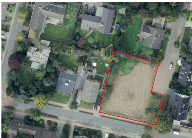
Auszug aus dem Luftbild - (Datenlizenz Deutschland Land NRW / Kreis Warendorf (2018) Version 2.0)