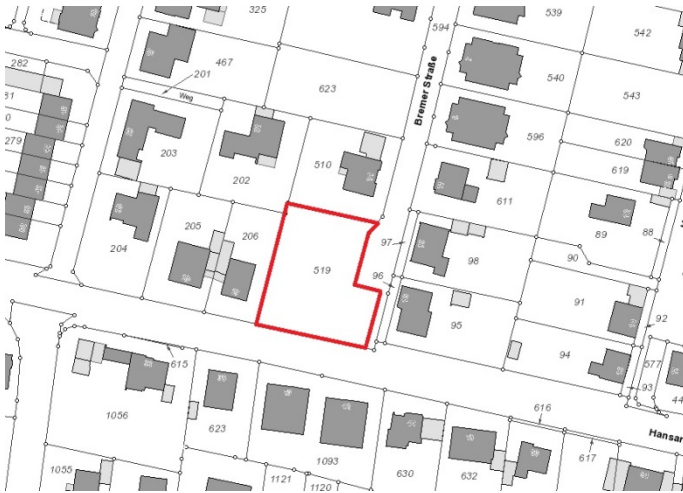
Auszug aus der Katasterkarte - (Datenlizenz Deutschland Land NRW / Kreis Warendorf (2018) Version 2.0)