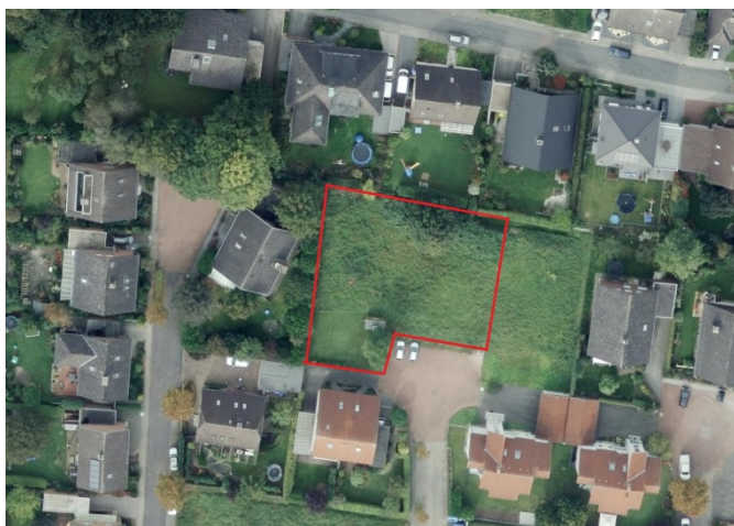
Auszug aus dem Luftbild