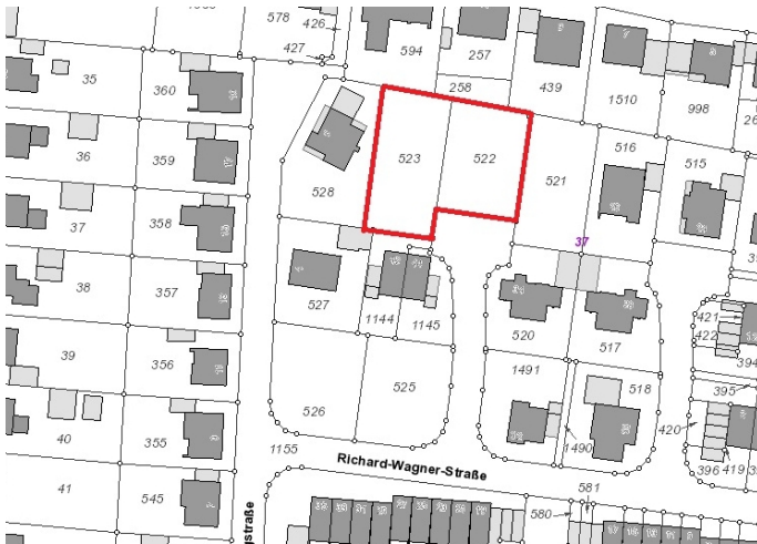
Auszug aus der Katasterkarte - (Datenlizenz Deutschland Land NRW / Kreis Warendorf (2018) Version 2.0)