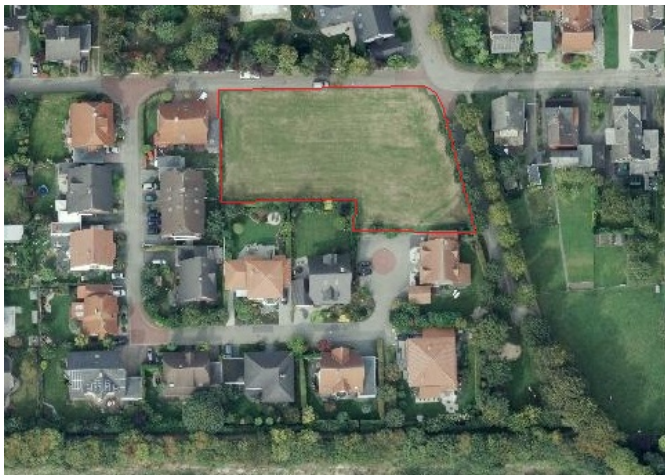
Auszug aus dem Luftbild