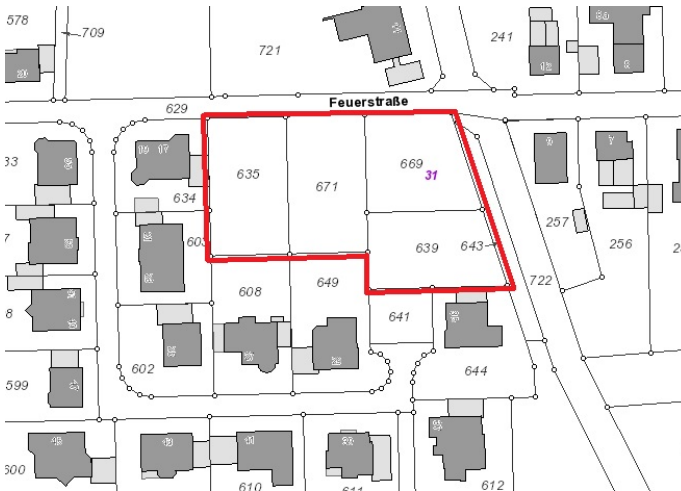
Auszug aus der Katasterkarte- (Datenlizenz Deutschland Land NRW / Kreis Warendorf (2018) Version 2.0)