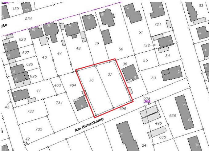
Auszug aus der Katasterkarte - (Datenlizenz Deutschland Land NRW / Kreis Warendorf (2018) Version 2.0)

Bebaubarkeit richtet sich nach §34 BauGB "unbeplanter Innenbereich"