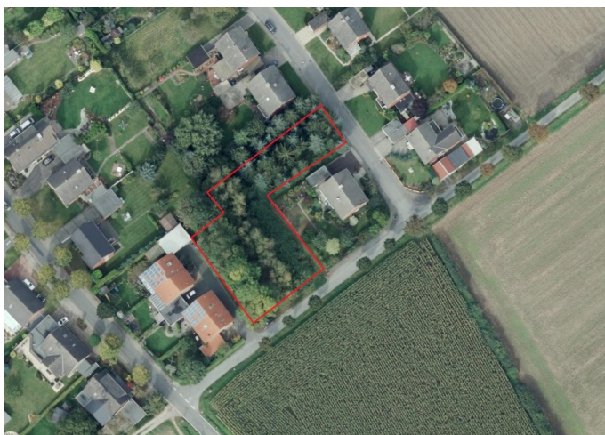
Auszug aus dem Luftbild - (Datenlizenz Deutschland Land NRW / Kreis Warendorf (2018) Version 2.0)