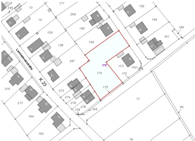
Auszug aus der Katasterkarte - (Datenlizenz Deutschland Land NRW / Kreis Warendorf (2018) Version 2.0)