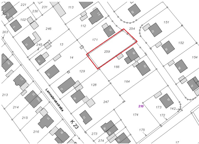
Auszug aus der Katasterkarte - (Datenlizenz Deutschland Land NRW / Kreis Warendorf (2018) Version 2.0)