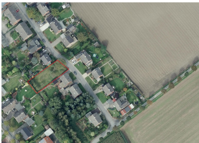
Auszug aus dem Luftbild - (Datenlizenz Deutschland Land NRW / Kreis Warendorf (2018) Version 2.0)